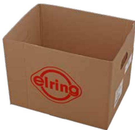
SCATOLA DI CARTONE